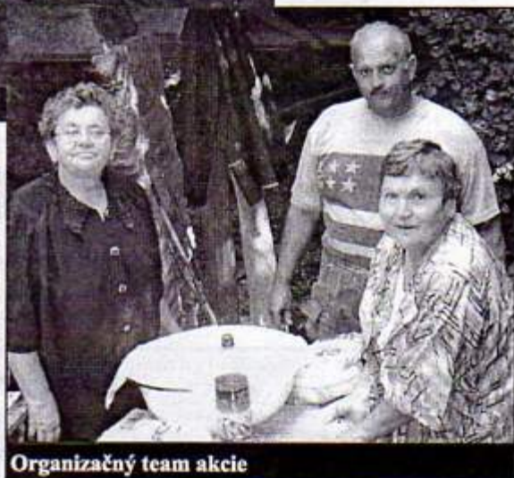
Organizačný team akcie