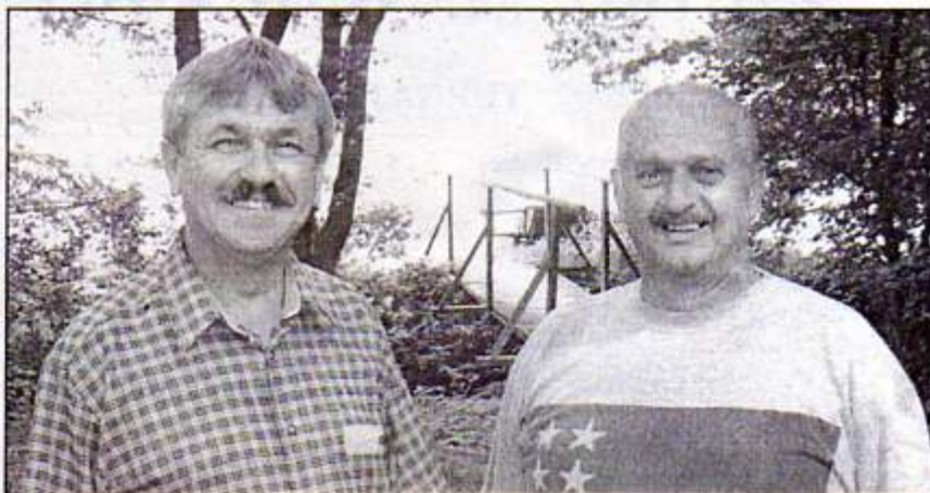
Poslanec NR SR a KSK s predsedom ZO JDS v Rakovnici

Zvýšenú pozornosť venoval okresu Rožňava, mestu Rožňava,