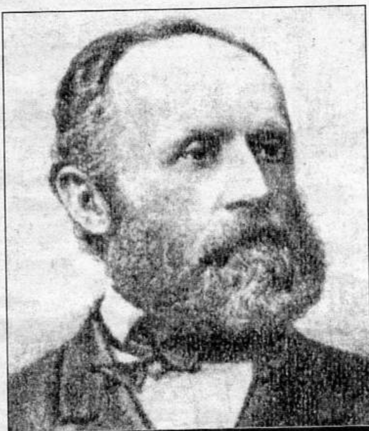
PAVOL DOBŠINSKÝ ČESTNÝ OBČAN OBCE

Náš národný umelec Vlado Mináč (rodák z Klenovca) povedal: „Dobšinského povesti boli a budú, pokiaľ bude slovenská reč“.