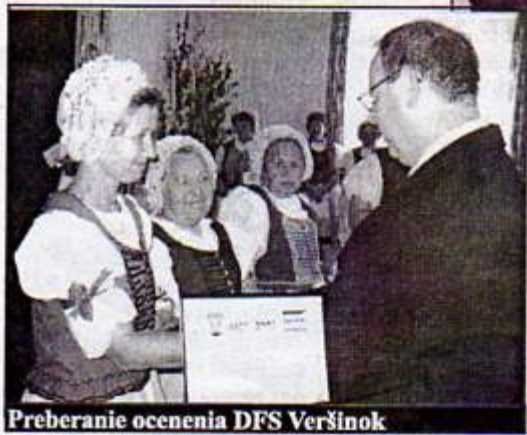
Preberanie ocenenia DFS Veršínok

Starosta obce v Sieni slávy slávnostne odovzdal individuálne ocenenie nasledujúcim občanom (uvedení sú podľa abecedy):