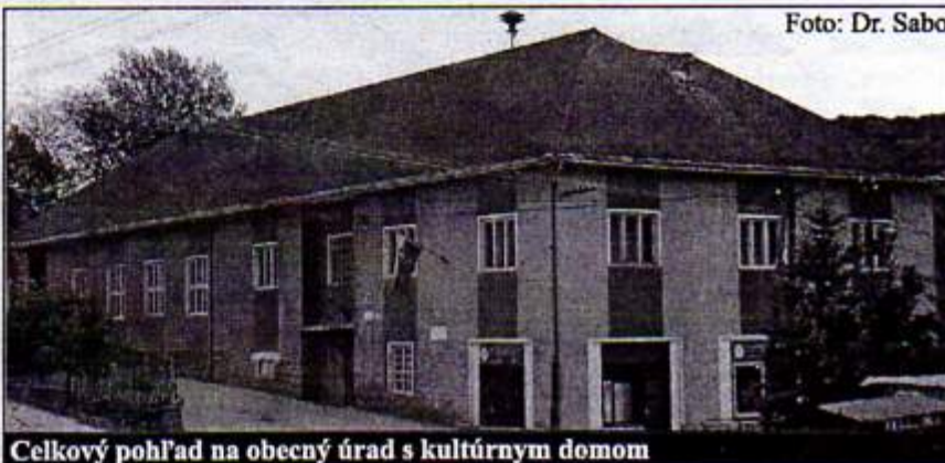
Celkový pohľad na obecný úrad s kultúrnym domom