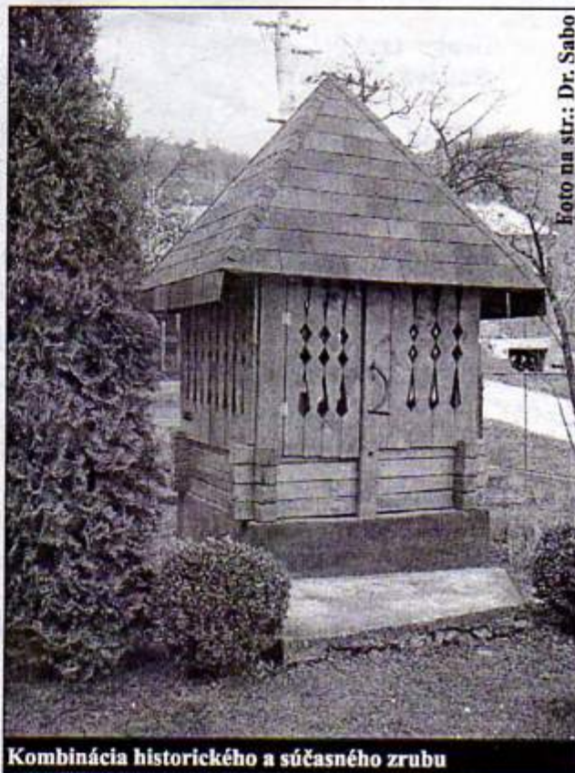
Kombinácia historického a súčasného zrubu