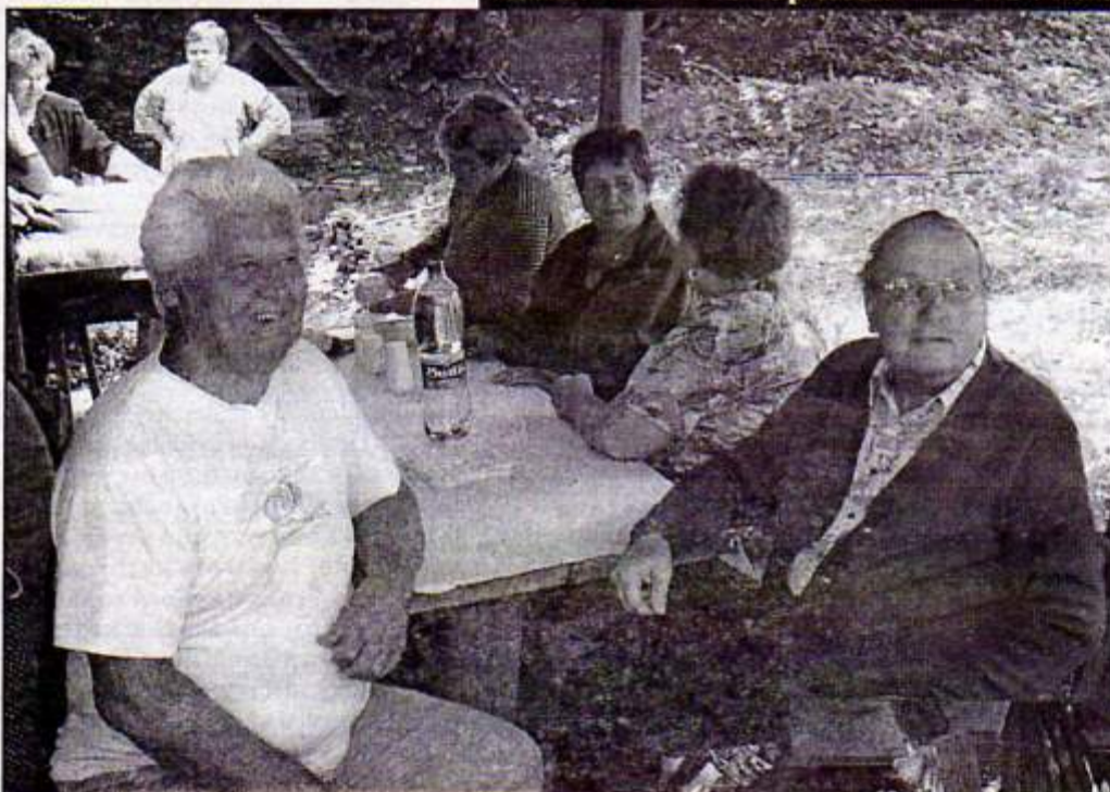
Čiastočný pohľad na účastníkov posedenia

obciam na trase Rožňava - Štítnik. Vo svojom príhovore oboznámil účastníkov podujatia aj so svojimi aktivitami pre obec Rakovnicu. Dôraz položil na potrebu tvorenia a predkladania projektov. Okrem toho ukázal ako to funguje v parlamente, na ministerstvách... V závere zdôraznil potrebu „napraviť chyby, ktorých sa v minulosti dopustila predchádzajúca vláda.“ Sľúbil pomoc v rámci svojich kompetencií i lobovanie na zlepšenie životných podmienok občanov obce i okresu