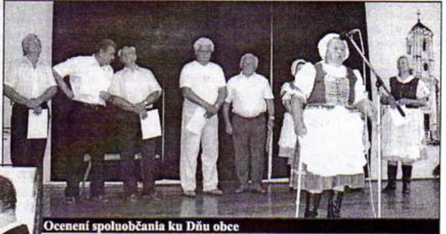
Ocenení spoluobčaní ku Dňu obce

Pri príležitosti 680. výročia od prvej písomnej zmienky o obci Rakovnica obecné zastupiteľstvo a starosta obce udelili ďakovné listy občanom obce, skupine, organizácii, kolektívu, ktorí sa významným spôsobom zaslúžili o rozvoj obce, aktívnu činnosť pre občanov, propagáciu obce, šírenie dobrého mena a dôstojnú reprezentáciu obce.