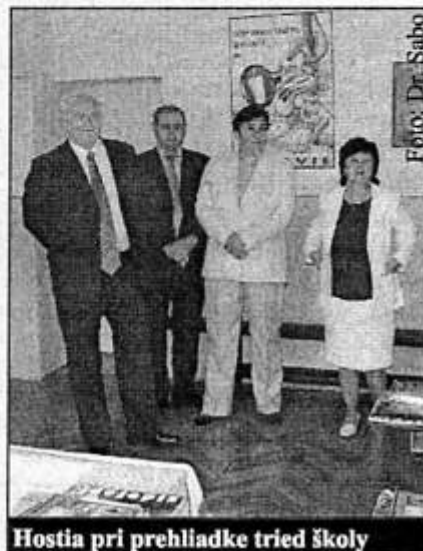
Hostia pri prehliadke tried školy

Rodičia i hostia si pozreli celú školu, ktorá z vnútra bola vynovená. Náš starosta navštívil všetky triedy, pozdravil sa so žiakmi z Rakovnice a poprial im „veľa zdravia, málo vymeškaných hodín a veľa chuti do učenia.“ - js -