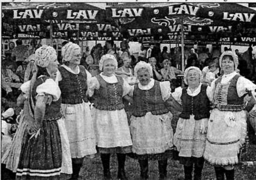
Účastníčky DFS Veršínok v Srbsku

Srdečné a milé privítanie v našom Rožňavskom okrese bolo v plnej miere opätované Slovákmí z Aradáča. Počas pobytu sa vytvorili nové kontakty a priateľské vzťahy. Obe strany do budúcnosti uvažujú o bližšom spoznávaní sa a nadviazaní ďalších kultúrnych a spoločenských stykov. Ing. O. Lorko