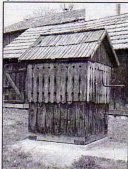
Obdĺžnikový zrub na studni

Problematika pitnej vody je v obci aktuálna. K myšlienke a rozhodnutiu napísať k tejto problematike článok som dospel na základe toho, že vraj obec je banskými prácami poddolovaná a to je príčina malého prítoku až úplného vyschnutia našich studní.