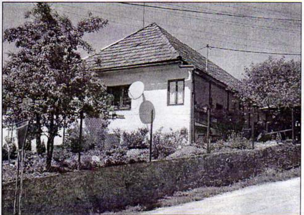
Vkusne upravený dom so záhradkou

Máje sa stavali tam, kde boli dievčatá (dievky). Stavali sa briezky alebo lipy. Tohto roku sme našli obe dreviny.