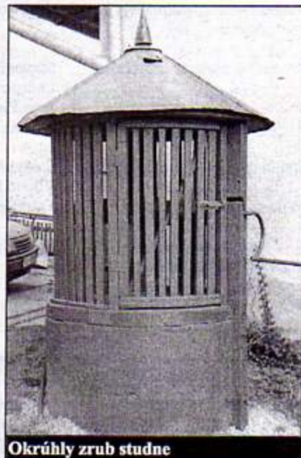
Okrúhly zrub studne

Príčinu treba hľadať v banských dielach. Banské diela Sadlovský a Štefan boli razené z Rožňavskej bane a Nadabulej. Dôvodom bola koľajová doprava a odvodňovanie. Konkrétne dedičná chodba Štefan siaha nad 12. obzorom až pod Mních. Na úrovni 24. obzoru je prepojenie Mních so Sadlovskou. A tu