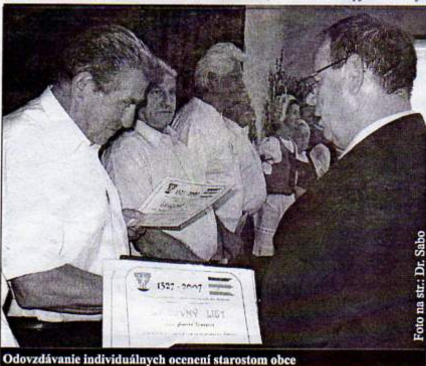
Odovzdávanie individuálnych ocenení starostom obce

V závere odovzdávania ocenení, starosta obce vyjadril nádej v