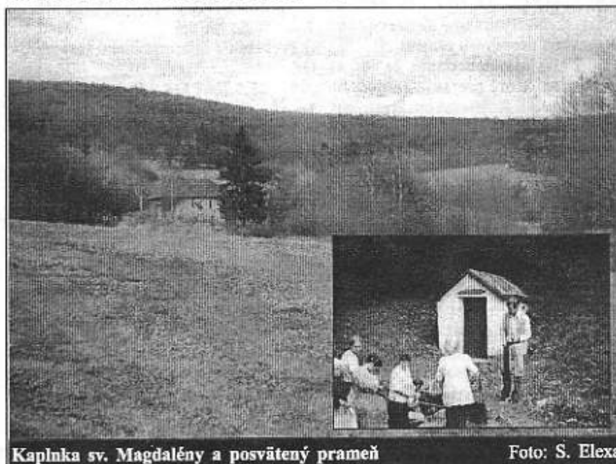
Kaplnka sv. Magdalény a posvätený prameň

V roku 1921 - 576 obyvateľov, v roku 1940 - 674 obyvateľov, v roku 1961 781 obyvateľov, roku 1970 - 796 obyvateľov. Musíme si uvedomiť, že v rokoch 1938 - 1945 bola Rekeňa pripojená k Maďarsku (hoci sa u nás