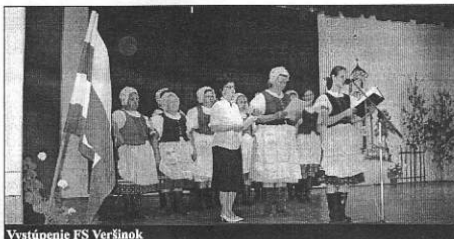
Vystúpenie FS Veršínok