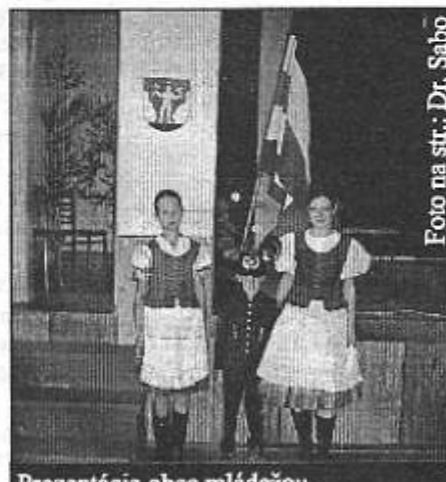
Prezentácia obce mládežou