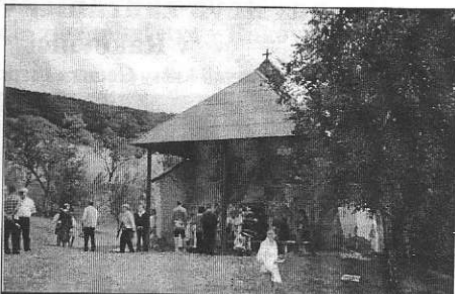
Pohľad na účastníkov svätej omše v kaplnke

Pozrime sa bližšie na príľahlý kopec Turecká a Zimná voda. To preto, že kopec Turecká (945 metrov nad morom) je pre nás Rakovníčanov ďalší skvost. Už názov Turecká hovorí o Tureckých vpádoch na naše územia a hrdinský boj našich pra - praotcov proti porobe a zotročeniu nás Slovanov od Turkov. Na vrchu bol železný kríž pri hroboch Turkov. Turci (cez svoje vzboje a poroby) boli na našom území (a teda aj na Iváďove) viac ako 400 rokov. Chceli nás Slovanov zničiť, aby deti našich predkov boli poturčené a zabudli na svoje slovanské korene. A my sme sa tomu ubránili! Nestratili a nezapredali sme svoj slovanský jazyk, svoju kultúru a svoju svojbytnosť. Doceňujeme my to dnes?