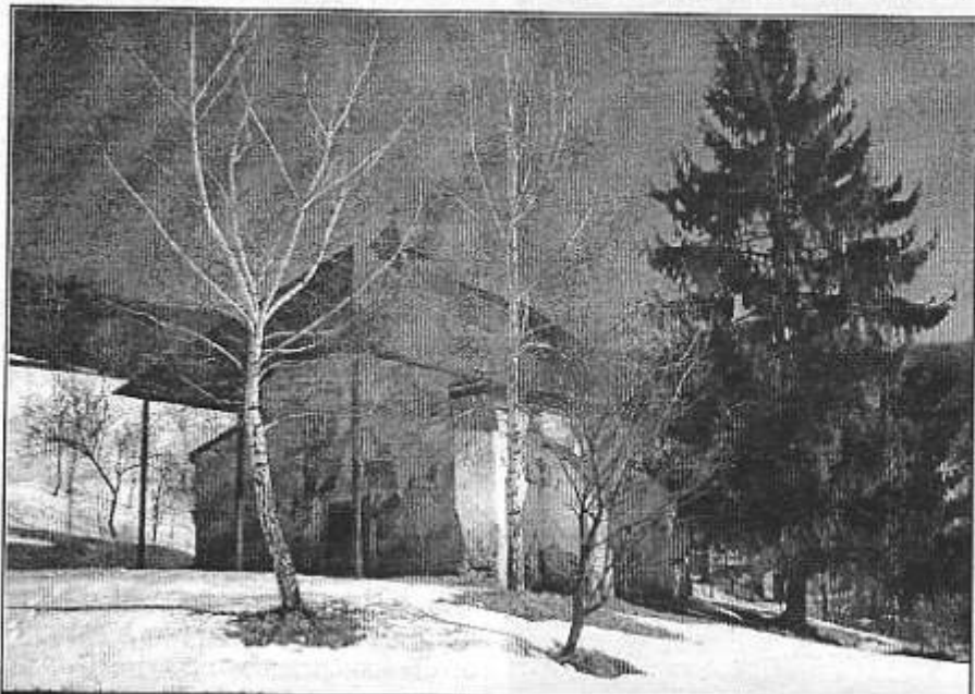
Romantický, zimný záber nášho kostolika

Podme na náš cintorín v Rakovnici. Pozrime sa nie na ten nový (tuzexový), ale na starý, kde pomníky sú z jednoduchého kameňa (a do neho vytesané rukou mená a roky narodenia a smrti našich predchodcov.) Keď toto doceníme (a mali by sme) snáď aj naši budúci potomkovia by nás mali doceniť, že my dnešná naša generácia sme nežili nadarmo, ale sme dochovali a zveľadili tvrdé mozole našich otcov a praotcov.