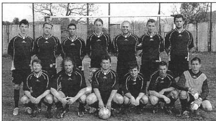
Futbalové mužstvo TJ Baník Rakovnica