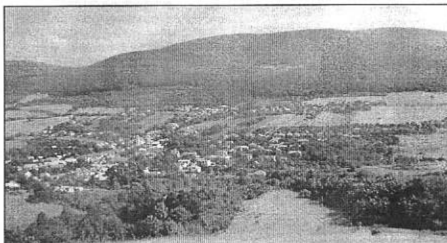
Pohľad na Rakovnicu a v pozadí Ivád'ov

Rozloha obce podľa vlastivedného slovníka je 701 hektárov, leží v západnej časti Slovenského krasu (Plešiveckej planiny). Obec Rekeňa, Rakovnica vznikla ako uhliarska osada na území hradu Brzotín asi v 13. storočí, keď vznikalo aj mesto Rožňava. Naši uhliari boli poddanými panstva na hrade Brzotín. Listinne je doložená táto uhliarska osada