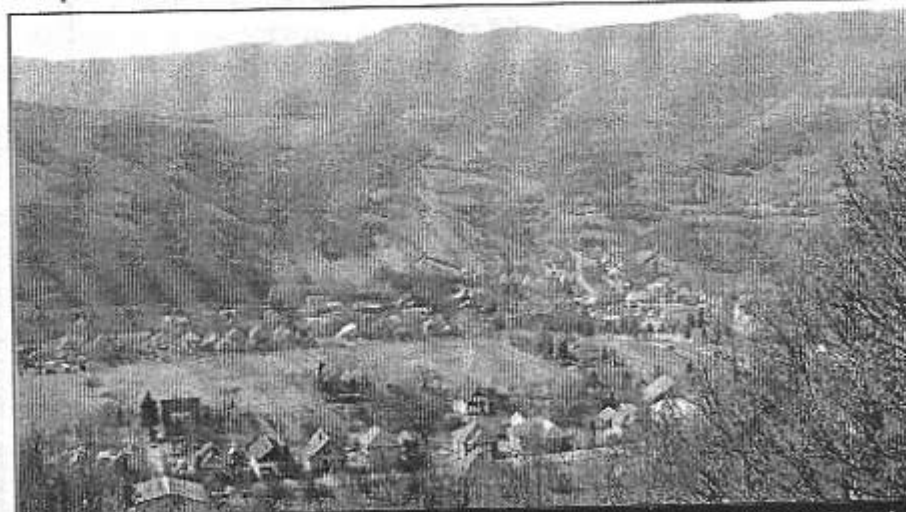
Pohľad na obec