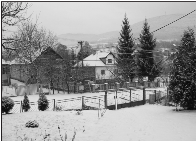
Romantické zimné pohľady